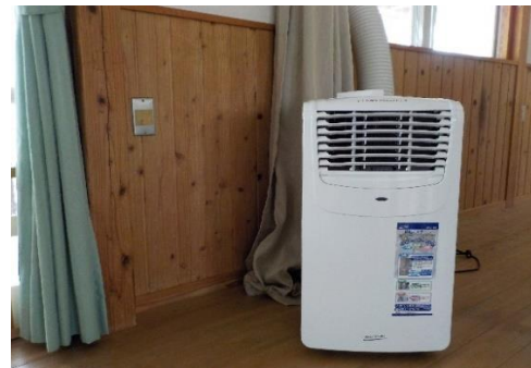
会議室に移動式エアコン設置