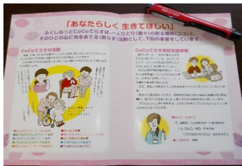
CoCoてらすのパンフレット作成

トイレの一角に、生理用品の無料配布コーナーを設置しました。さまざまな困りごとを抱えた方に相談してもらえるような場所になることを願っています。