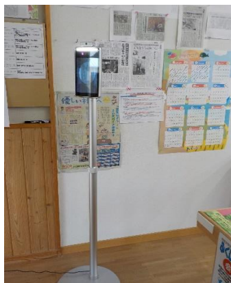
感染症対策のため サーモカメラ設置